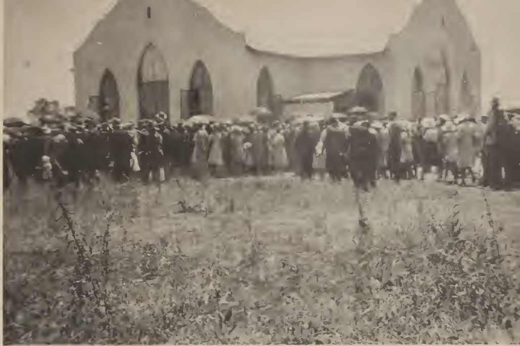
Hoeksteenlegging en inwyding van die eerste baksteen kerkgebou op die plaas Buffelsdrif op 13 Februarie 1943. Na tien jaar het hierdie kerkgebou se mure onder die swaar dakwerk ingegeë. Die gebou is gesloop en op dieselfde fondasie is 'n saal gebou.